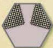
Sieć działająca w 2 kierunkach