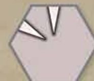
Strzał w dwóch kierunkach