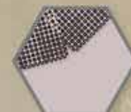
Sieć działająca w dwóch kierunkach