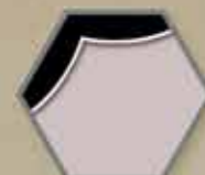
Pancerz chroniący dwa boki