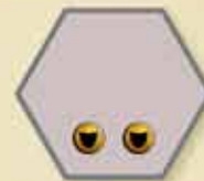
Jednostka z 2 punktami Wytrzymałości

Każda rana, zadana Wytrzymałej jednostce, oznaczana jest za pomocą znacznika Ran.