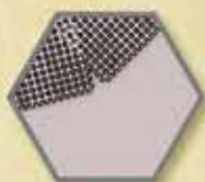
Sieć działająca w 2 kierunkach

Aby łatwiej pamiętać, które jednostki są wyłączone przez Sieć, można umieścić znacznik Sieci na takiej jednostce. Znacznik należy usunąć, gdy jednostka przestanie być pod wpływem Sieci (jeśli ma to miejsce podczas Bitwy, to znacznik należy usunąć na końcu segmentu Inicjatywy, w której jednostka została uwolniona).