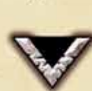
Atak wręcz (cios)

Na awersach żetonów Wojowników, oprócz ilustracji ich przedstawiających, znajdują się symbole określające działanie każdego żetonu. W grze występują cztery podstawowe symbole. Są to: