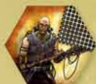
Jednostka bez symbolu Inicjatywy