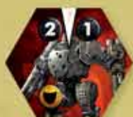
Jednostka z Inicjatywą 1 i 2