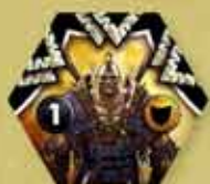
Jednostka z Inicjatywą 1