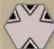
Cios w czterech kierunkach