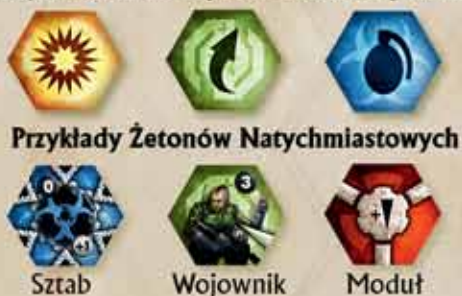
Przykłady Żetonów Natychmiastowych

Przykłady obu rodzajów żetonów zaprezentowane są na ilustracji: